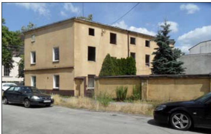
Kamienica przy ul. Mariackiej 18 obecnie.

Nadzór budowlany w Poznaniu udzielił nam jedynie informacji, że prowadzi postępowanie wyjaśniające, podjęte w wyniku jakiegoś zgłoszenia złożonego przez właścicielkę sąsiedniej kamienicy. Redakcja nie jest stroną więc na tym etapie odmawia się jej bliższych informacji . md