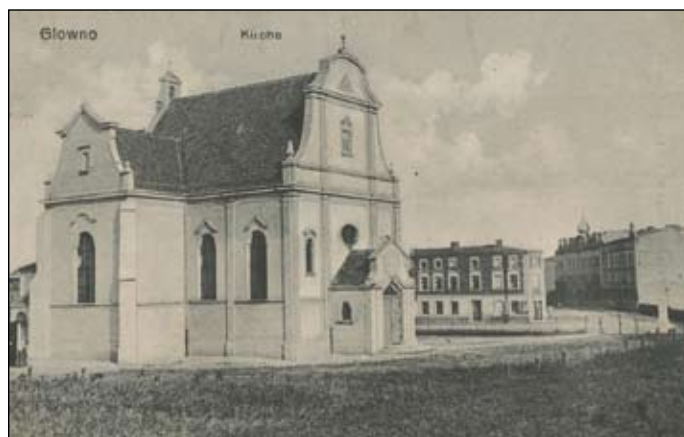
Kamienica widoczna na pocztówce z ok. 1914 roku.