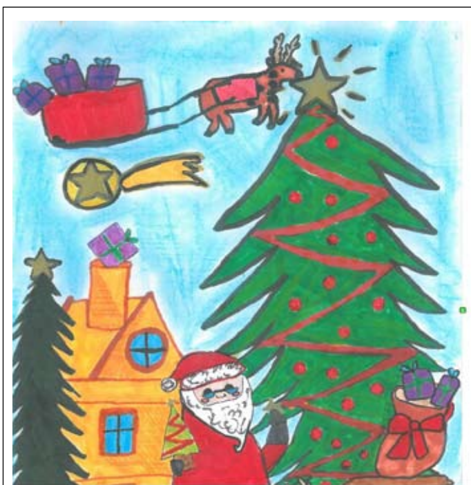
Wykonała Dagna Stroiwąs uczennica klasy 6 Zespół Szkolno-Przedszkolny nr 7

Przy wigilijnym stole łamiąc opłatek święty, po- mnijcie, że dzień ten radosny, w miłości jest po- częty, że jako mówi nam wszystkim, dawne, od- wieczne orędzie pierwszą na niebie gwiazdą Bóg w naszym domu zasiędzie. Jan Kasprowicz