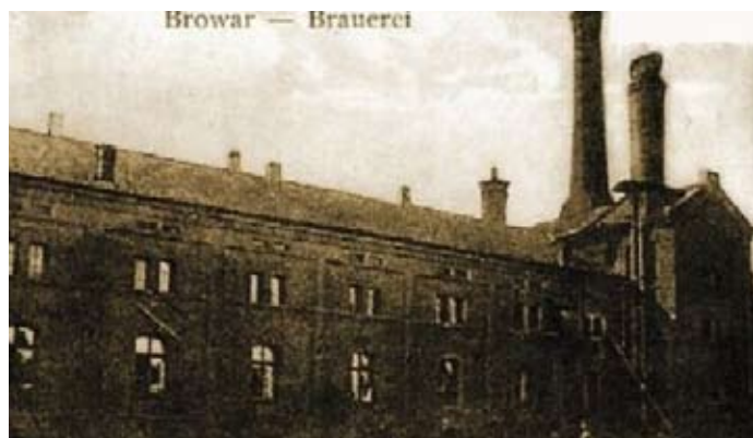
Browar Mycielskich w Kobylepolu przed I wojną.

Nickel Dewelopment 2