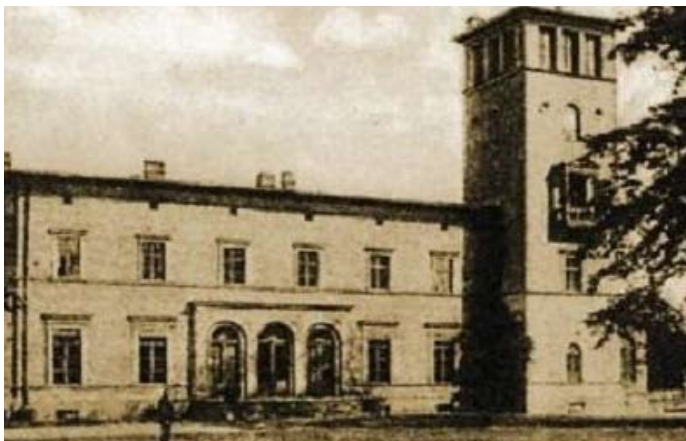
Nie istniejący już pałac Mycielskich w Kobylepolu

Budowa rozpoczęła się w latach 60., a pierwsze piwo wyprodukowano w 1872 roku. Był to pierwszy w Wielkim Księstwie Poznańskim obiekt tego typu. Miejscowy złoty trunek szybko stał się znany nie tylko w Polsce, lecz także za granicą – eksportowany był m.in. do Niemiec i Włoch. Do popularności kobylepolskiego piwa zapewne przyczyniła się także jego niezwykle promocja – początkowo bowiem piwo to rozdawano za darmo - ale także znakomitej jakości woda.