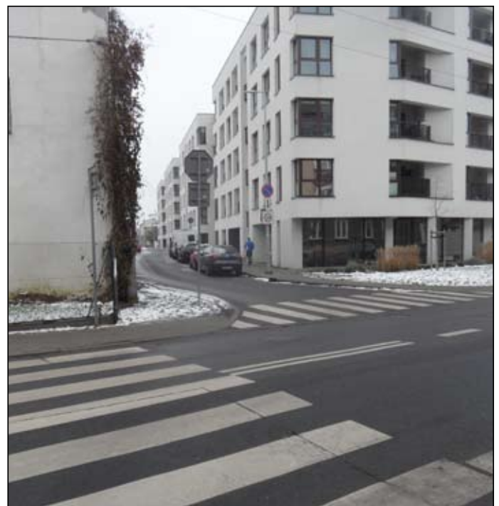
Zbieg ulic Smolnej i Mariackiej

Jednak decyzję o finansowaniu takiego przedsięwzięcia powinna podjąć Rada Osiedla nowej kadencji (kadencja obecnej Rady wygasa 21 kwietnia 2024 r.), podczas prac na projektem planu wydatków na 2025 r., a wybór optymalnego rozwiązania powinien zostać uzgodniony pomiędzy MIR a Osiedlem.