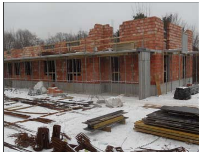
Trzy komunalne budynki mieszkalne mają podziemne garaże i powstają z ceramicznych pustaków.