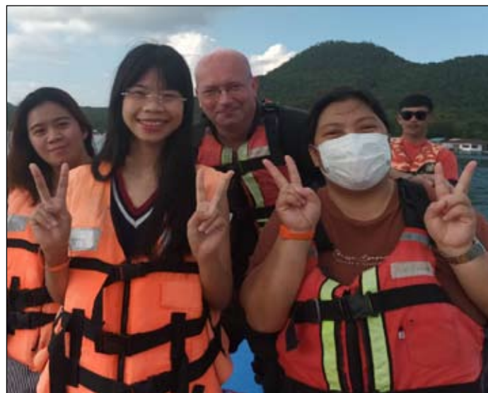
Autor z koleżankami z pracy podczas imprezy na jeziorze.