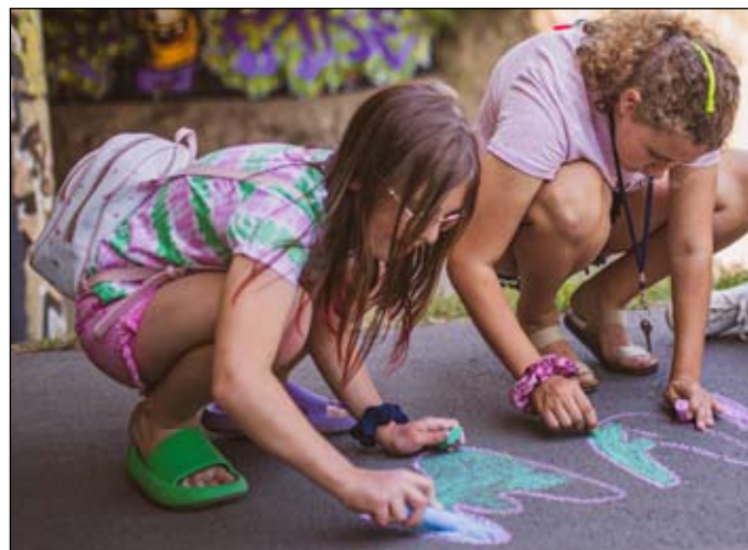
2 fot. Ula Jocz

10.05. godz. 16:00 MUR BETON poezja pisania kredą po murach prowadzenie: Maria Lehmann informacje: maria@animatorzysmak.pl , tel. 789 311 619