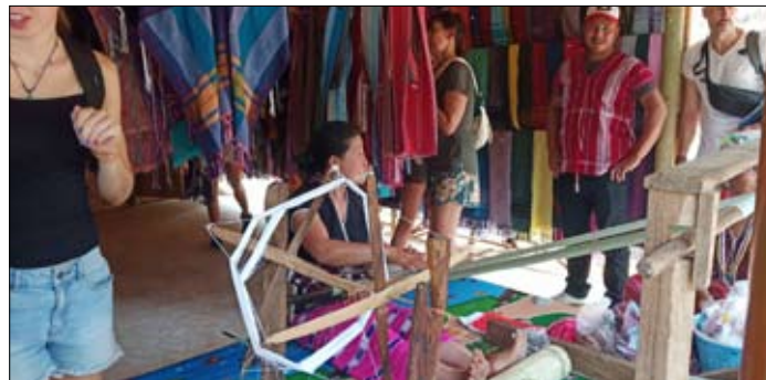
Kobiety Karenów tkają przepiękne makatki.

wchodzimy na szczyt Doi Inthanon. Szczerze mówiąc – nie zrobił na mnie większego wrażenia. Zrozumiałem wtedy dlaczego wędrowaliśmy do niego szlakiem wodospadów, wiosek kareńskich itp. Sam szczyt rozczarowałby każdego turystę. Jako ciekawostkę