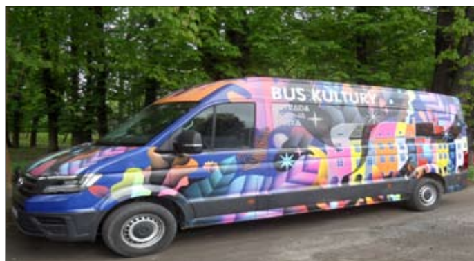
"Busem Kultury" przyjechała Estrada Poznańska