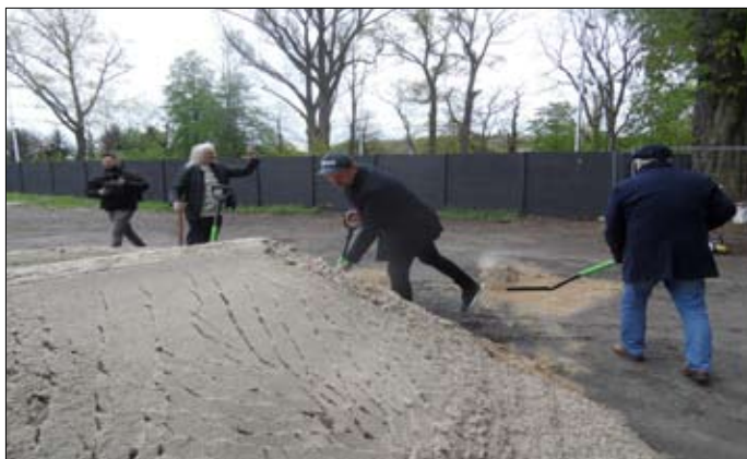
Symboliczne wbicia łopat na placu budowy w dniu jej rozpoczęcia 22 kwietnia 2024 r.

Za treść ogłoszeń nie odpowiadamy. Tekstów nie zamówionych nie zwracamy. Zastrzegamy sobie prawo skracania i adiustowania tekstów oraz zmiany tytułów. Anonimów nie publikujemy.