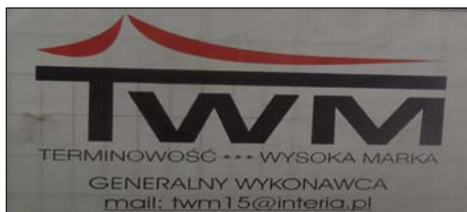
Baner firmy budującej Dom Kultury.