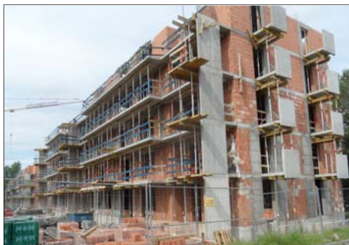
Dwa budynki nad rzeką Głównią.