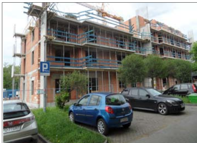
Budynek przy ul Nadolnik