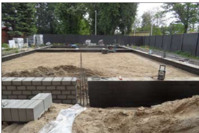
Po kilku dniach gotowa już była podmurowka na wylanym fundamencie.