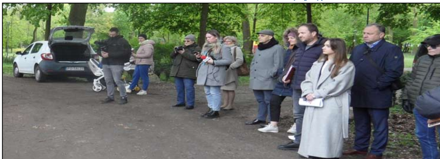
Goście na tle parku oczekujący na zwyczajowy ceremoniał rozpoczęcia budowy.