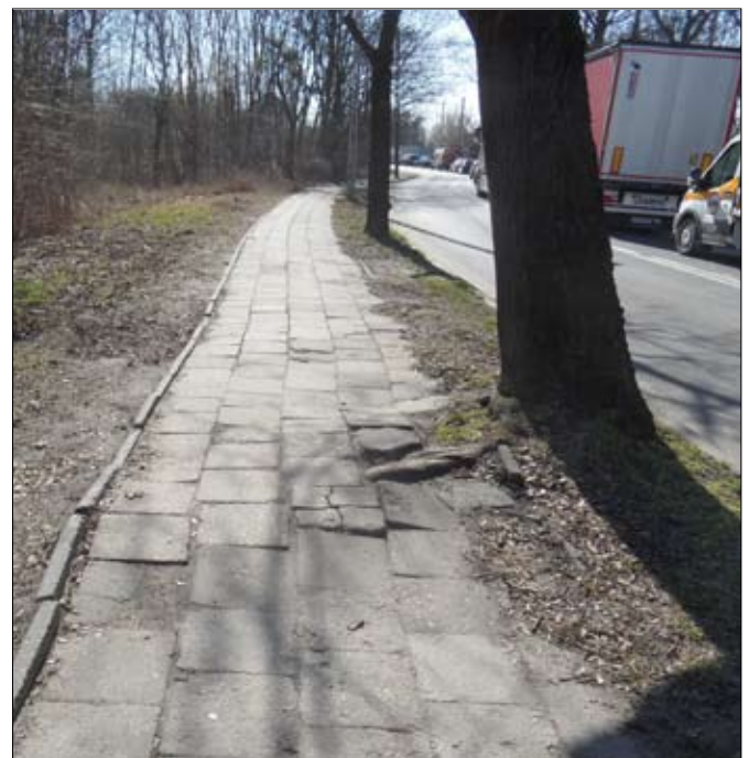
Chodnik na ulicy Krańcowej zostanie w bieżącym roku wyremontowany.