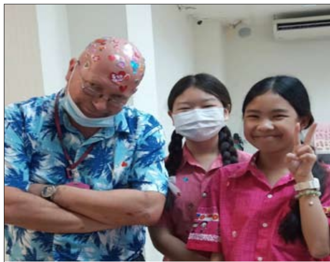
Pod koniec dnia zjąłem z łepetyny około stu serduszek..

Należy przy tym nadmienić, że dekorowanie serduszkami mojej głowy mogło być dwuznacznie odebrane przez niektórych Tajów. Trzeba pamiętać, że głowa jest w tajskiej kulturze najświętszą częścią ciała. Jest siedliskiem myśli i uczuć. Dotknięcie głowy Taję to gruby nietakt!