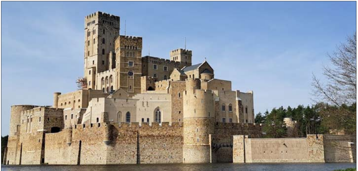
Nielegalnie zbudowany ogromny zamek w Stobnicy , po latach grożącej mu rozbiórce właśnie zostaławnie zalegalizowany