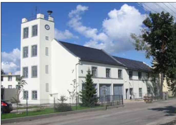
Uratowana przez właścicieli firmy GAL stara strażnica jest i pozostanie chlubą Główny

Stosunkowo długie istnienie tego lokalnego czasopisma jest m.in. skutkiem jego dobrej współpracy z licznymi piszącymi mieszkańcami małych ojczyzn oraz wsparcia ze strony właścicieli firm życzliwie lokujących promocje na łamach „MY”. Dzięki takiej pomocy przyjaciół owego miesięcznika zdołał przetrwać różne zagrożenia i kryzysy, jak choćby podczas powszechnego zastoju w czasie wirusowej pandemii.