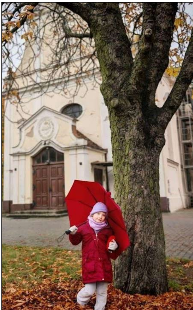
Pierwsza nagroda - Lena z klasy 1c