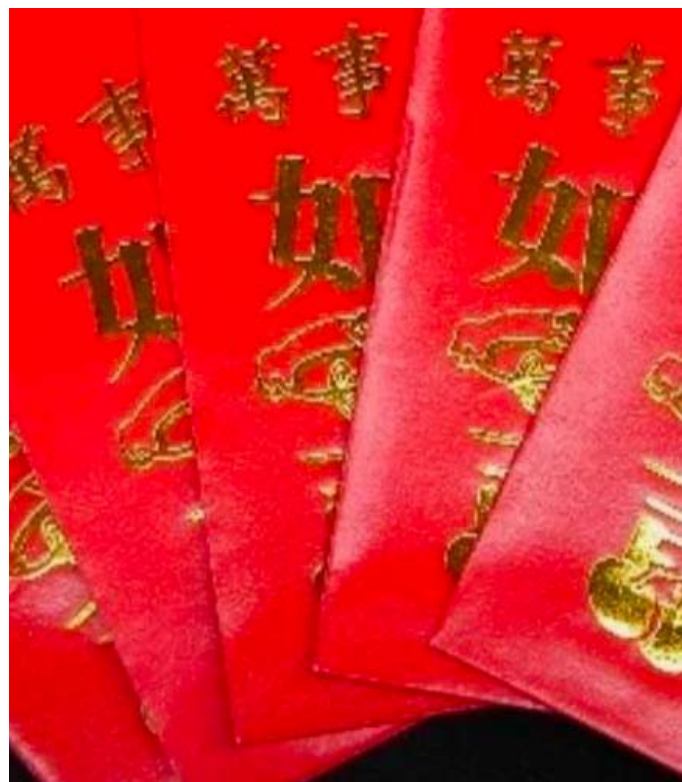
Dzieci otrzymują od rodziców „hongbao”, czyli czerwone koperty z drobną sumą pieniędzy. Zazwyczaj jest to równowartość kilku-kilkudziesięciu naszych złotych.

Ale uwaga! Suma tych pieniędzy nie może zawierać liczby 4 (nie można podarować np. czterdziestu lub czterystu bahtów). Liczba 4 jest bowiem uważana w Chinach za wyjątkowo pechową – w języku chińskim „cztery” brzmi identycznie jak „śmierć”.