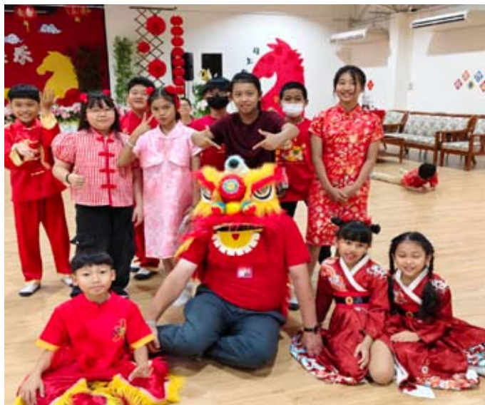
Szczęśliwego Chińskiego Roku życzy Smok Matt ze Smoczętami!

Wielu Tajów ma bowiem chińskie korzenie, a jakby tego było mało – setki tysięcy Chińczyków przyjeżdża-